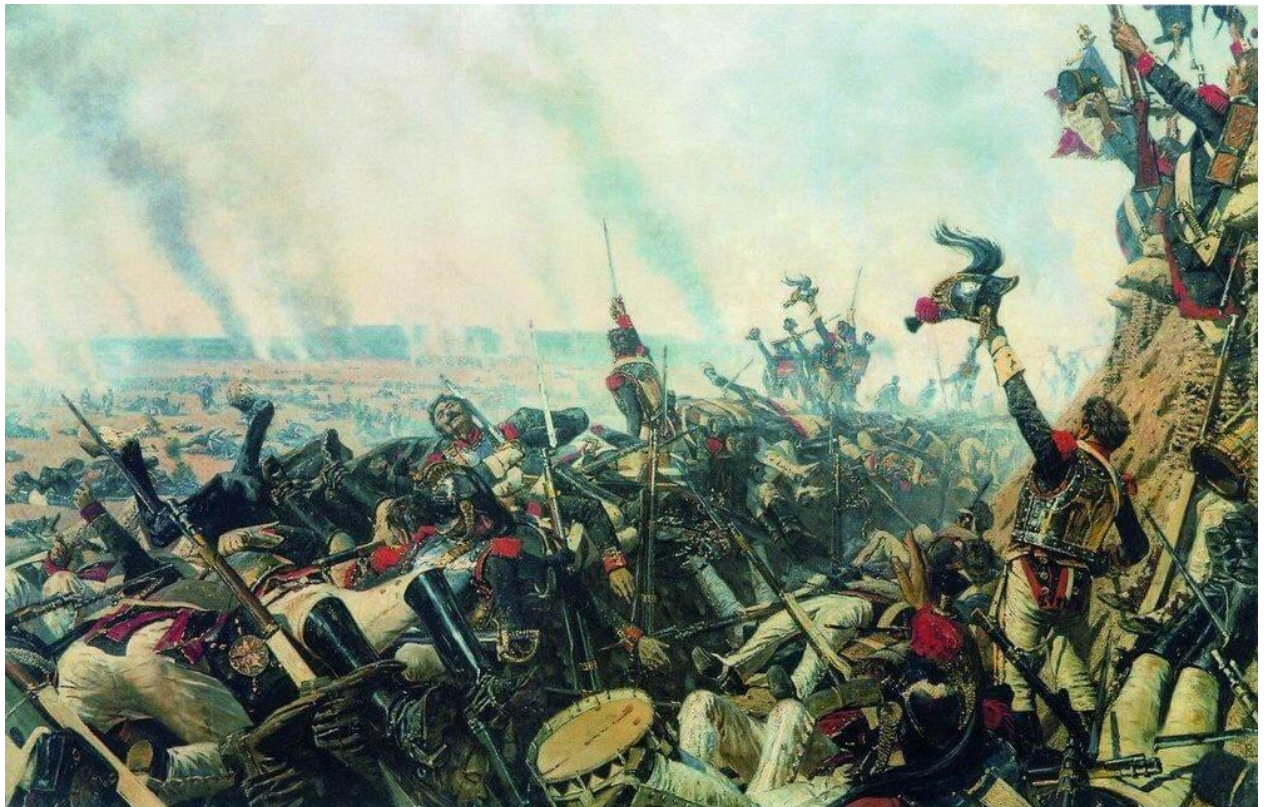
«Конец Бородинского сражения» (Наполеон в России). 1900