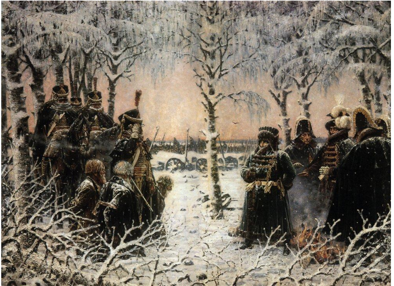
«С оружием в руках – расстрелять!» (Наполеон в России). 1887-1895