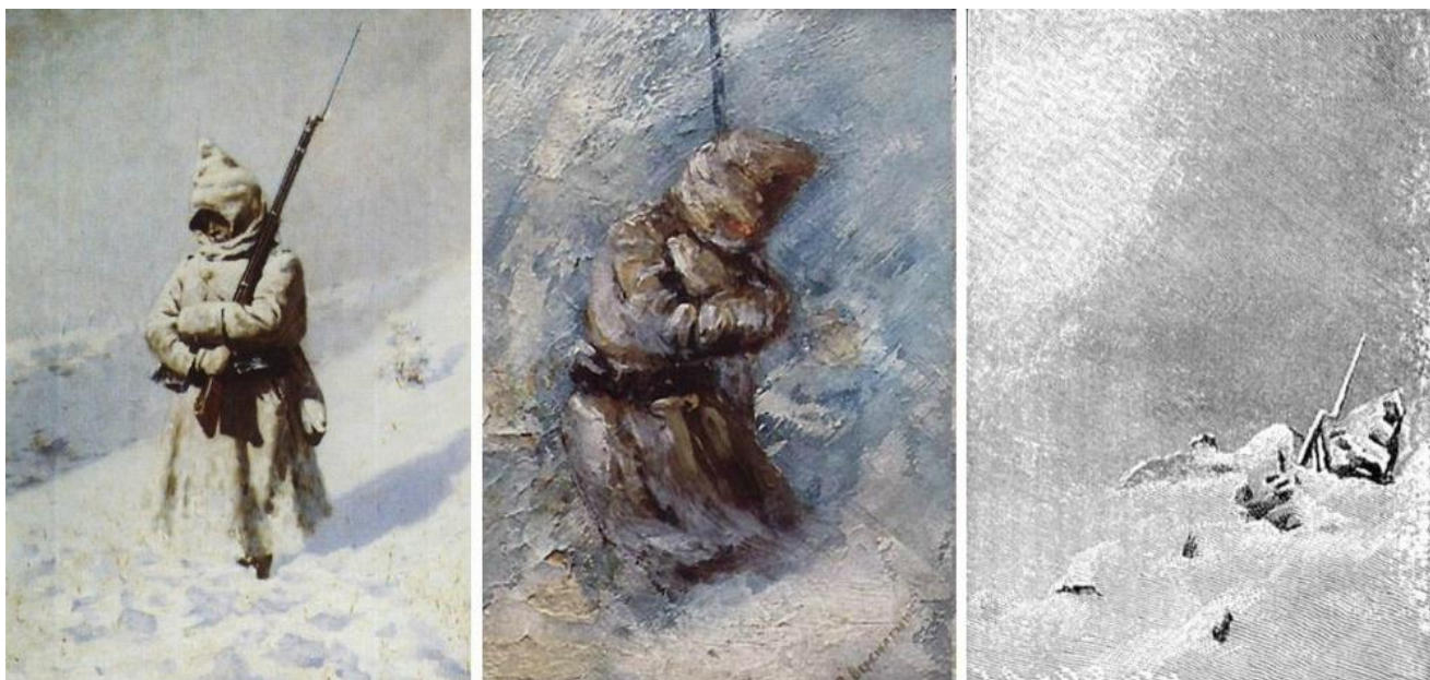
«На Шипке всё спокойно» (Балканская серия). 1879