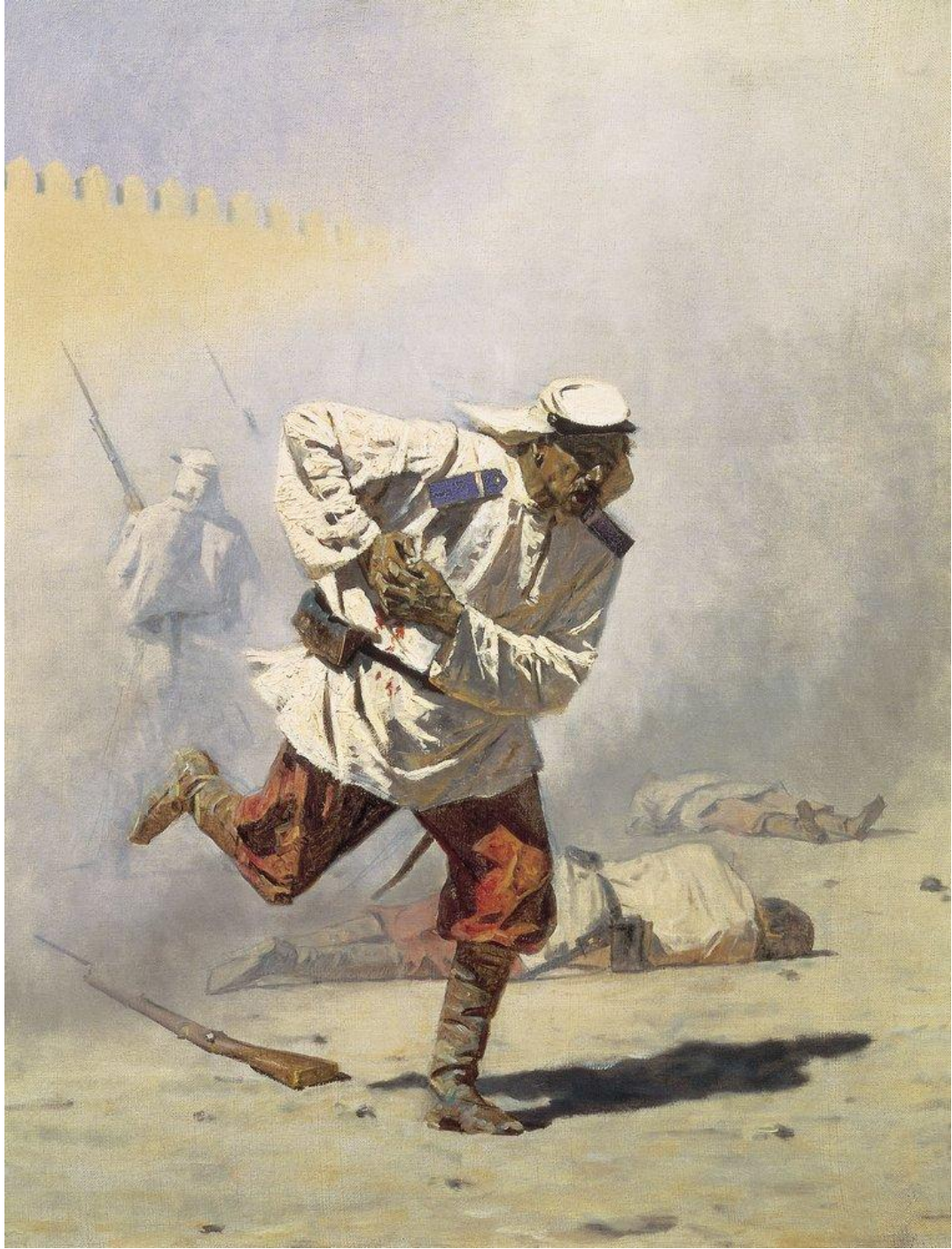
«Смертельно раненный» (Туркестанская серия). 1873