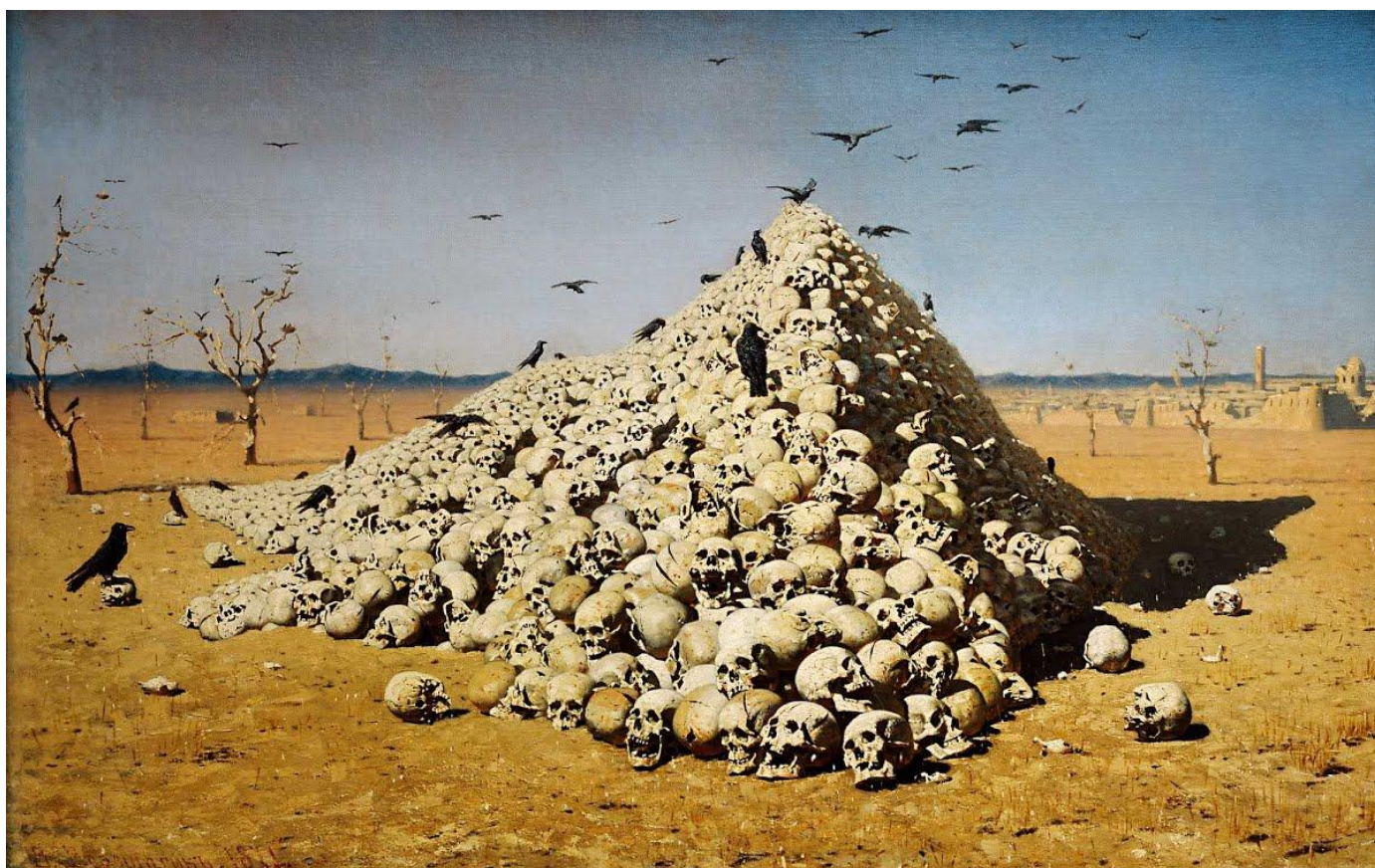
«Апофеоз войны» (Посвящается всем великим завоевателям, прошедшим, настоящим и будущим) (Туркестанская серия). 1871