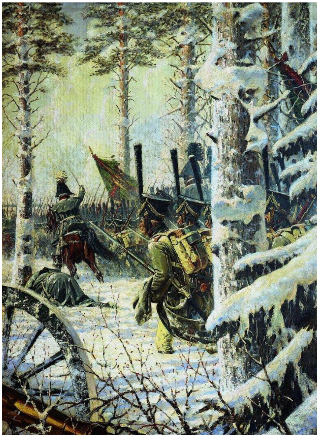
«В штыки! Ура! Ура!» (Наполеон в России). 1887-1895