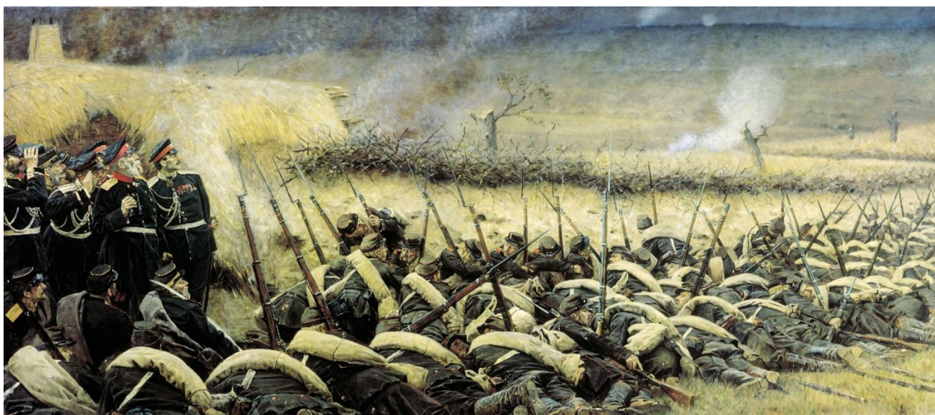
«Перед атакой. Под Плевной» (Балканская серия). 1881