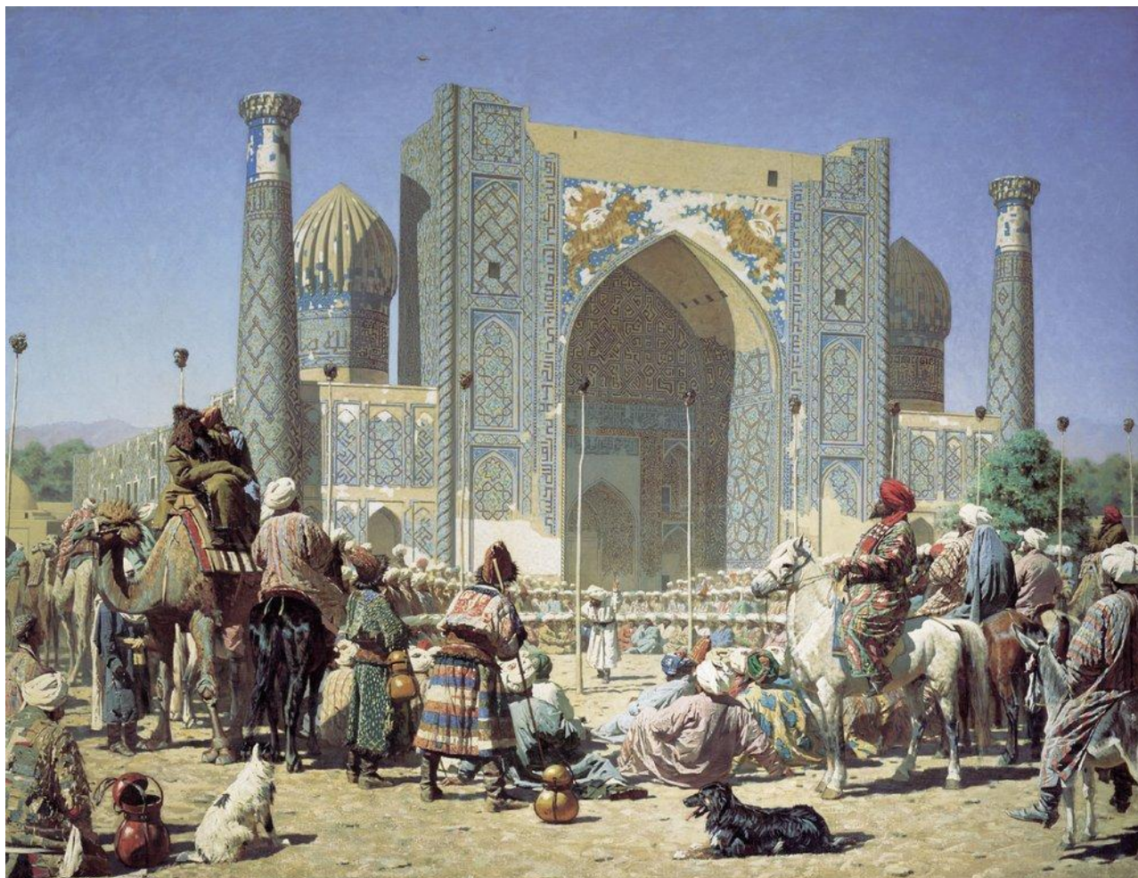
«Торжествуют» (Туркестанская серия). 1872