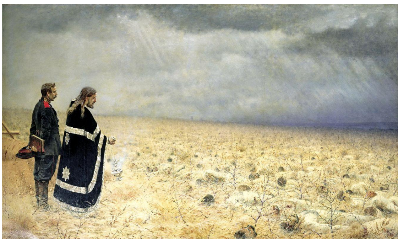
«Побеждённые. Панихида» (Балканская серия). 1879