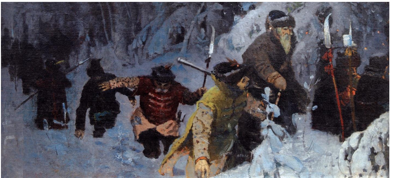
Михаил Нестеров. «Иван Сусанин». 1884.