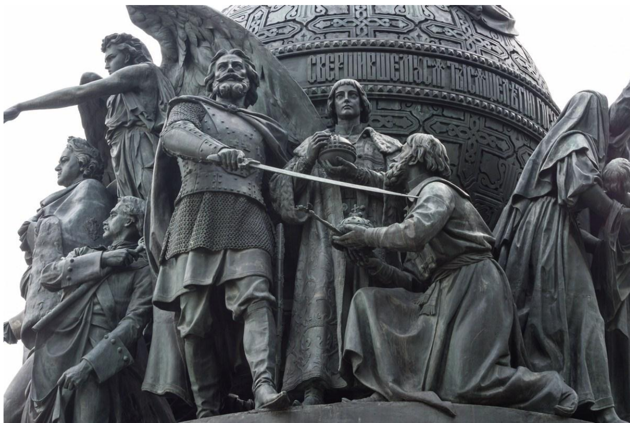
Михаил Микешин. Фрагмент памятника «Тысячелетие России», изображающий Михаила Романова, Дмитрия Пожарского и Кузьму Минина, 1862.