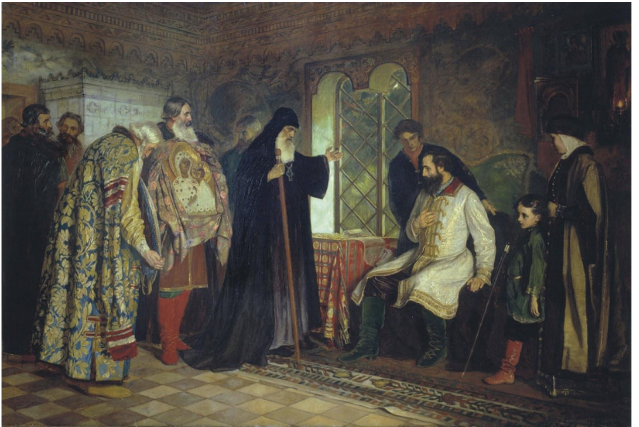
Василий Савинский. «Нижегородские послы у князя Дмитрия Пожарского». 1882.