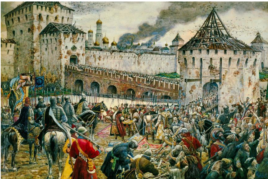
Эрнст Лиснер. «Изгнание польских интервентов из Московского Кремля». 1908.