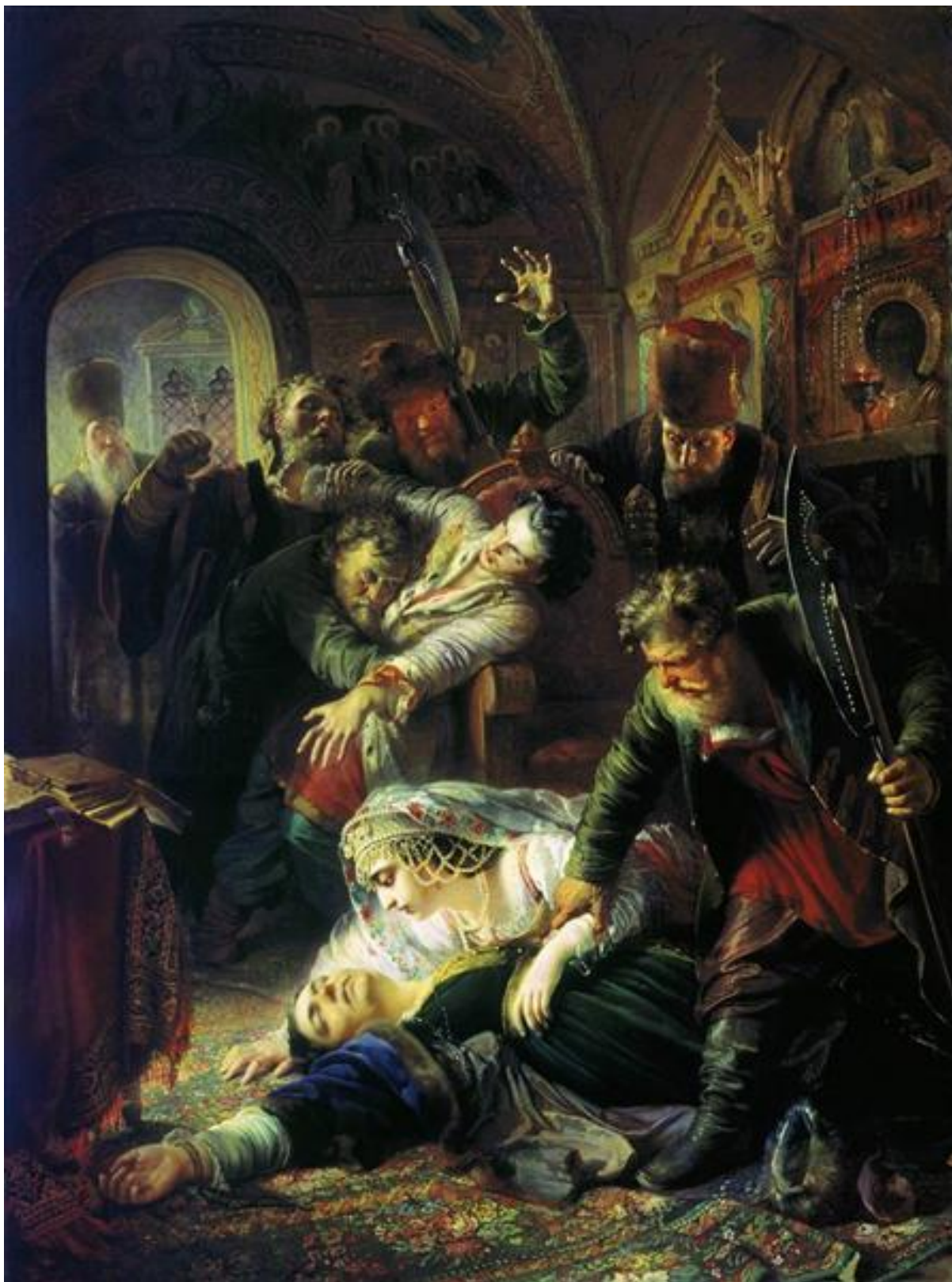
Константин Маковский. «Агенты Дмитрия Самозванца убивают сына Бориса Годунова». 1862.