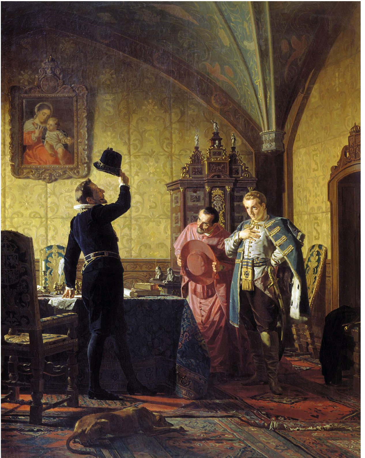
Николай Неврев. «Присяга Лжедмитрия I польскому королю Сигизмунду III на введение в России католицизма». 1874.