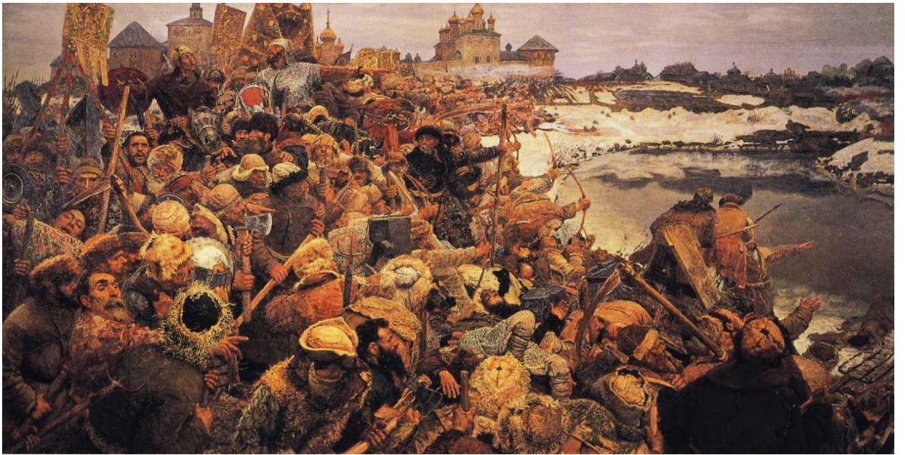
Гавриил Горелов. «Восстание Болотникова». 1944.